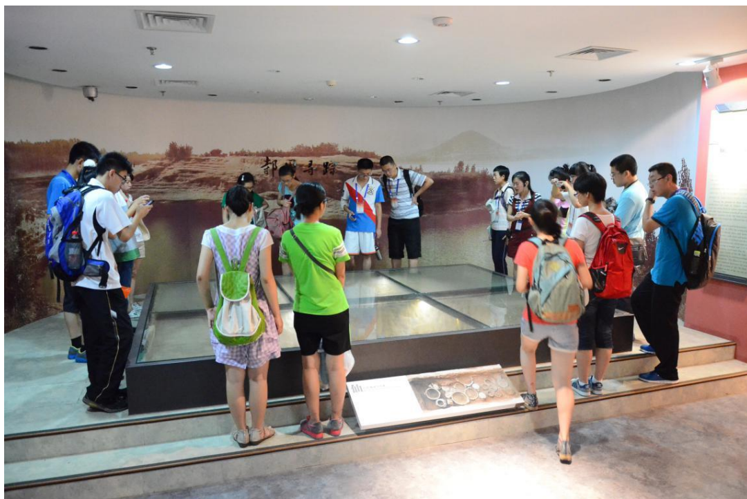
(图为营员们参观山东大学博物馆)

都收获了很多不一样的体验，也享受到了来自山东大学的温暖和关爱。山东大学的实验室、百年历史的趵突泉校区、啤酒梦工厂、山东省科技馆……多姿多彩的科学营生活带给营员们对大学生活的更多期待。