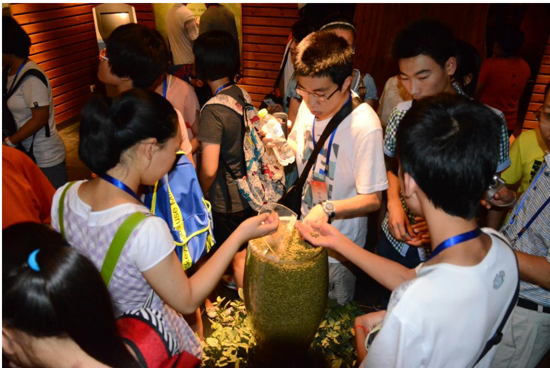
(图为营员参观青岛啤酒梦工厂济南分厂)

我是山东东平明湖中学的一名高中生，从上学开始便对大学有着热烈而深切的向往。想象之中大学会有着诺大的校园、幽静的林荫小道、各方面顶级的大师、免费开放的游泳馆、校园各点往来的大巴车……大学生应该过着天堂一般的生活，每天过的忙碌而充实，泡图书馆、做兼职、自己创业……终于，在科学营的活动中，我迈进了山东大学的校门，有幸在我高中生涯中第一次这么近距离的接近一所文化底蕴如此深厚的大学。